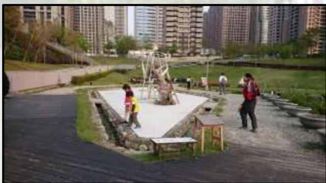
(圖五)排水道沒標誌