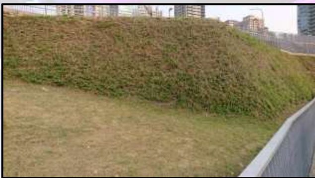
(圖二)缺乏管理維護