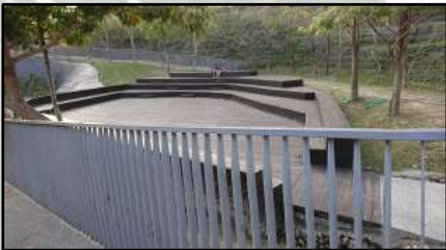
(圖十一)木棧台休息區