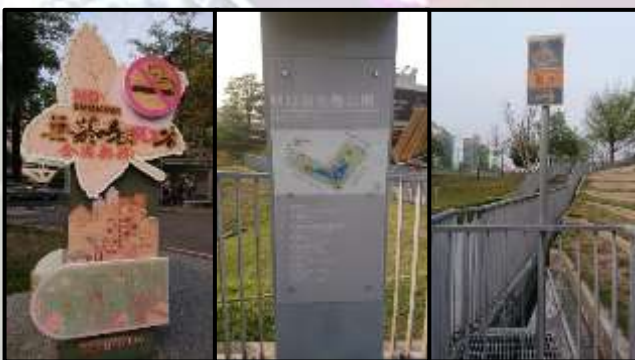
(圖六)排水道沒標誌