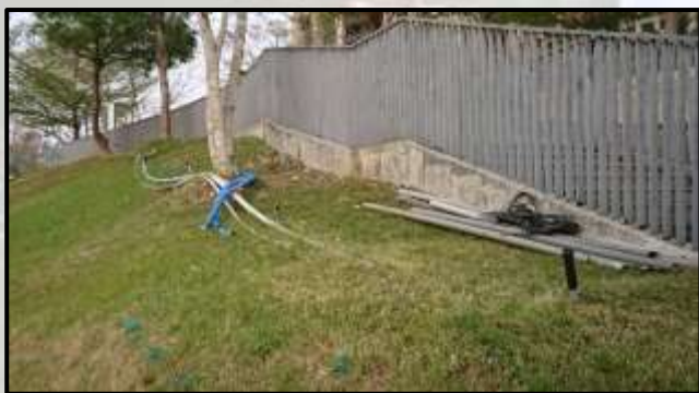
(圖三)灌溉用水管外露