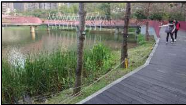
(圖四)生態池僅用繩索