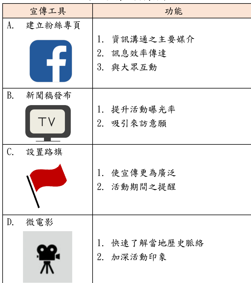
表 5 宣傳工具簡介表