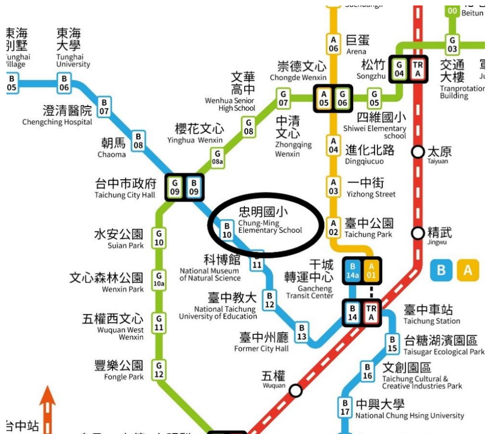
圖 2 台中捷運草案

台中市捷運目前預計今年底將陸續完工，其中忠明國小站位於精誠商圈不遠處，擬定一個草案讓忠明國小站設置多個出口，其中一個出口為精誠商圈旁，步行約 2-3 分鐘即可到達該商圈。