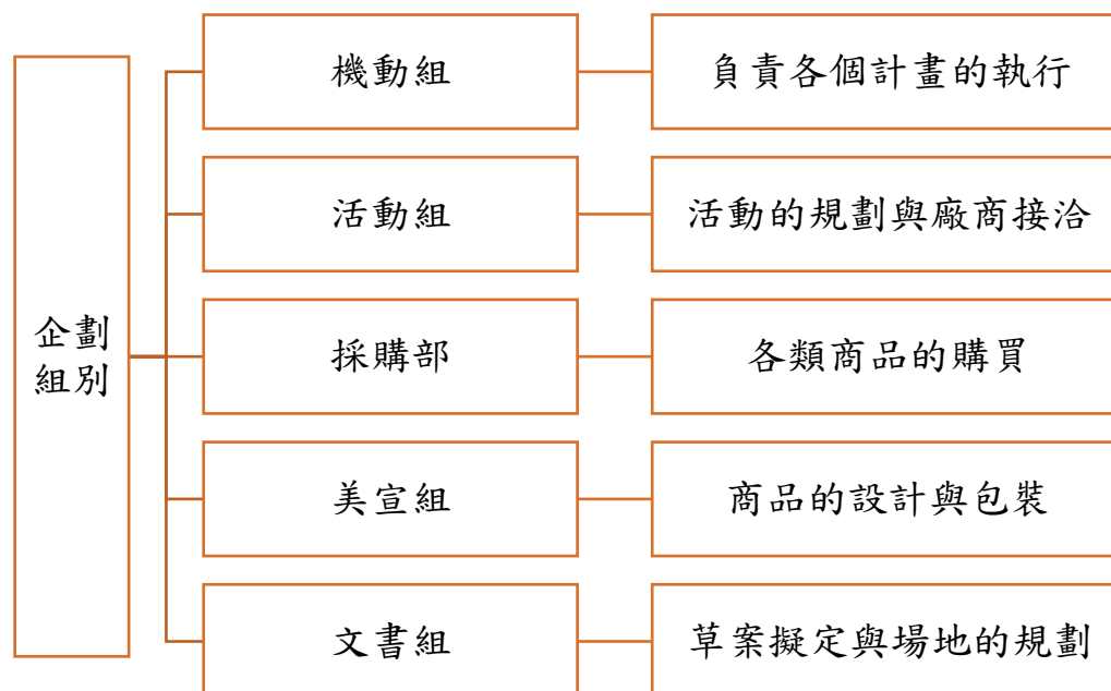
表 6 工作進度表